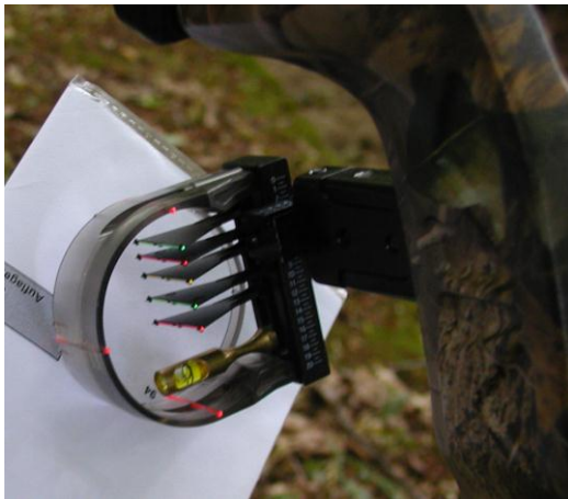
(Visier ohne Linse für CI)

Das Visier, welches am Bogen angebracht ist, darf sowohl höhen- wie seitenverstellbar sein. Eine Wasserwaage sowie Vergrößerungslinsen und/oder Prismen sind zulässig. Das Visier darf an einem, am Bogen befestigten Vorbau, angebracht sein. Es darf keinerlei elektrische oder elektronische Hilfsmittel enthalten. Es sind bis zu 5 Zielpunkte, senkrecht übereinander, im Visier zugelassen.