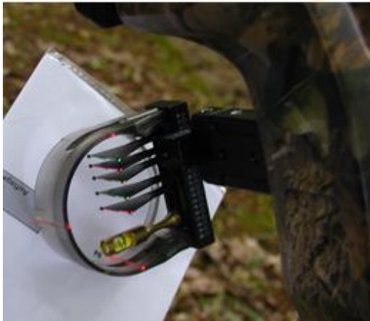
(Visier ohne Linse für CI)

Das Visier, welches am Bogen angebracht ist, darf sowohl höhen- wie seitenverstellbar sein. Eine Wasserwaage sowie Vergrößerungslinsen und/oder Prismen sind zulässig. Das Visier darf an einem, am Bogen befestigten Vorbau, angebracht sein. Es darf keinerlei elektrische oder elektronische Hilfsmittel enthalten. Es sind bis zu 5 Zielpunkte, senkrecht übereinander, im Visier zugelassen.